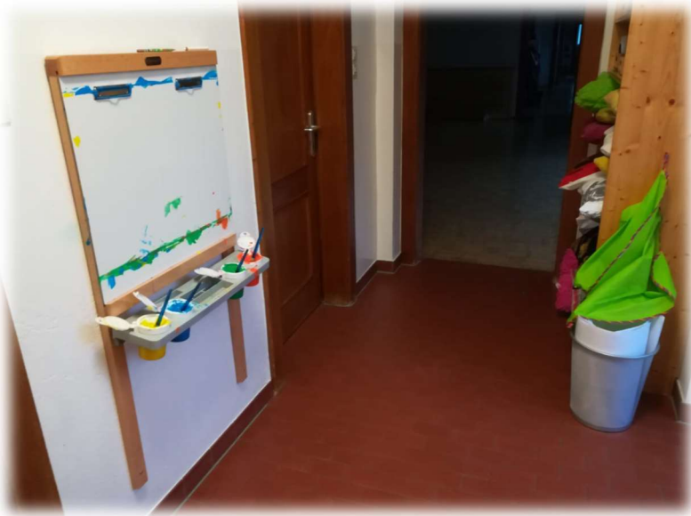
GANG MIT MALWAND