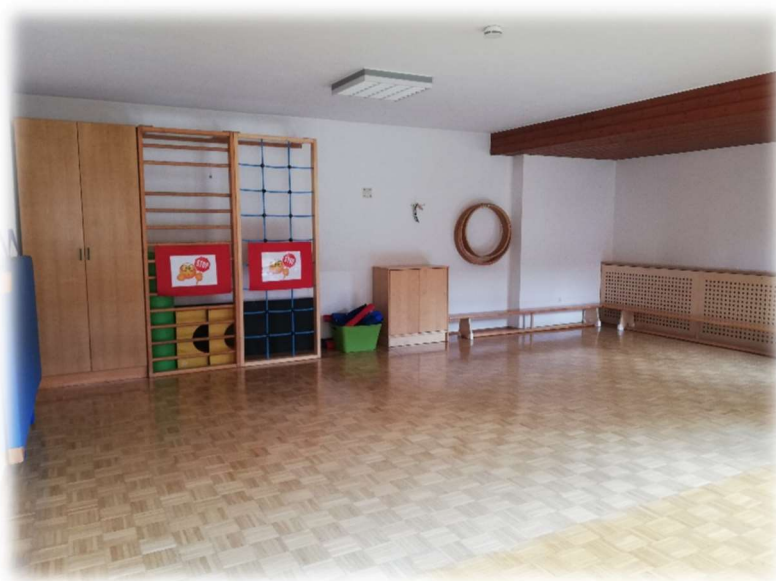
BEWEGUNGSRAUM DER MOND- UND SONNENGRUPPE